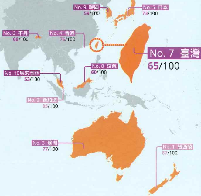
亞太區國家排名前十位置圖